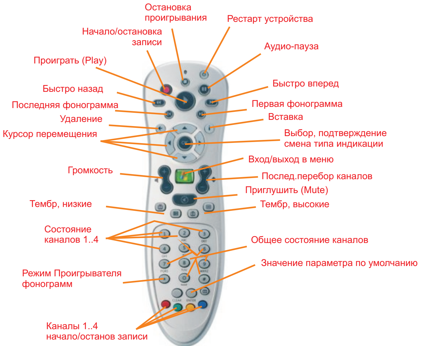
Стандартный ИК пульт управления Microsoft (протокол RC-6)